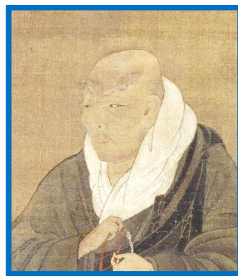
仙台市博物館でお会いした 親鸞さま

10時 おつとめ (正信偈・和讃) 10時30分 ご法話 (休憩含む) 12時 お斎 13時30分 帰敬式※ 14時30分 ご満座