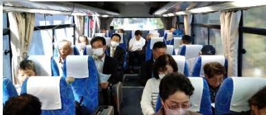
バスの中で見どころの解説